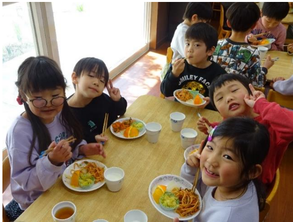
みんなで食べると美味しいね♪