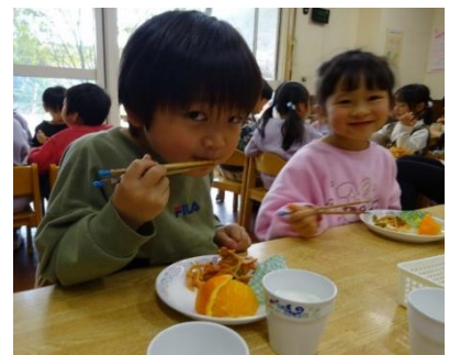
箸の持ち方もとても上手になりました★